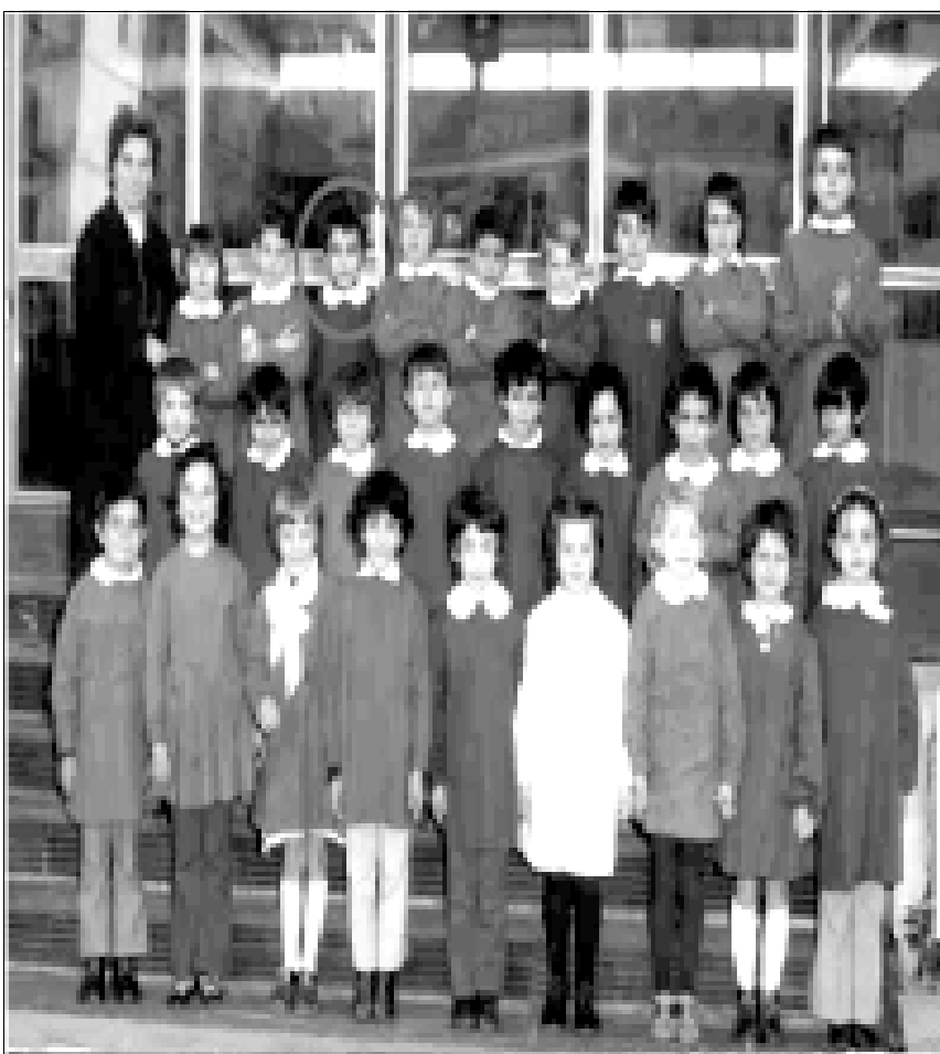
(nel cerchietto, l'unico allievo dei corsi di formazione che non ha mai sbadigliato)

Vedremo... adesso è appena iniziato il secondo quadrimestre... e nonostante la sensazione frequente di essere stracolmi, bisogna vedere i risultati della prossima verifica. Per ora va bene, non ci sono rilievi da