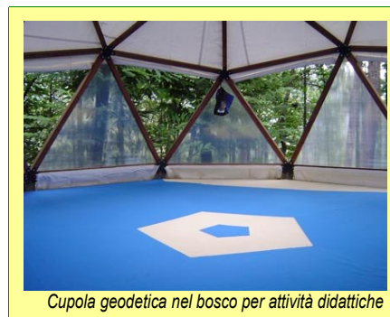
Cupola geodetica nel bosco per attività didattiche