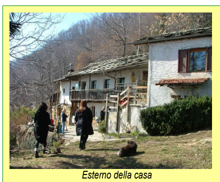
Esterno della casa

Se siete interessati, telefonate allo 0121.91070 o scrivete a kanbio@libero.it