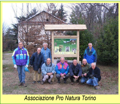
Associazione Pro Natura Torino