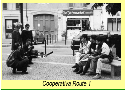
Cooperativa Route 1