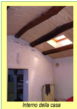
Interno della casa