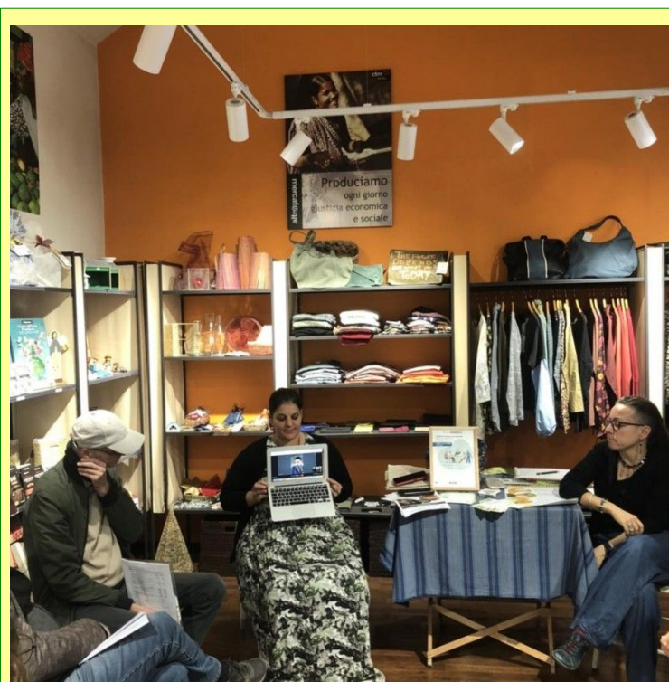
Incontro dei soci sovventori della cooperativa Della rava e della fava il 29/10/22 ad Asti

Facciamo rete, sosteniamoci a vicenda, e così potremo proseguire con le nostre attività, e forse andare più lontano, insieme.