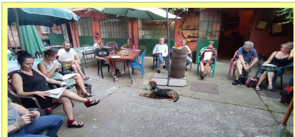
Assemblea dei soci il 15/06/22 a Torino

Come coordinamento delle MAG italiane, nell'ultimo anno, abbiamo lavorato insieme per dar vita ad un tavolo fra le MAG e Banca Etica, cercando di attivare un piano di confronto e di possibili sinergie fra le realtà e creando reali spazi di collaborazione su tematiche di reciproco interesse.