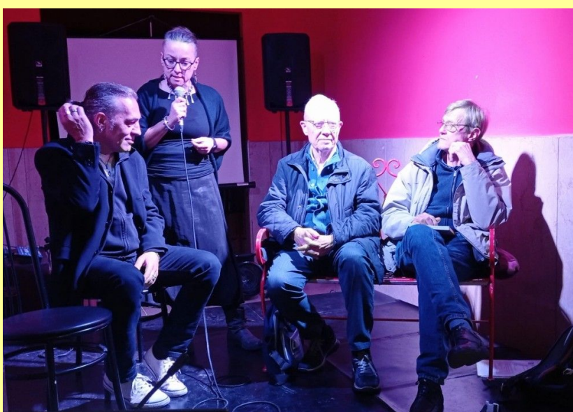
Finanz(i)a cosa? Un altro clima è (ancora) possibile? La necessità di un radicale cambio di rotta

In assemblea dovremo anche decidere dove destinare eventuali avanzi di gestione o come gestire eventuali disavanzi: l'indicazione del Cda è, in linea con gli ultimi anni, quella di aumentare il fondo rischi .