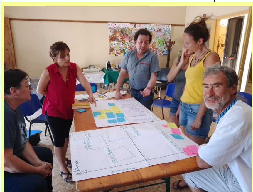
Pianificazione straordinaria il 03/07/22 a Rubiana (TO)

Nella prossima assemblea di bilancio prevista indicativamente per il mese di giugno, ci sarà anche il rinnovo cariche della cooperativa MAG4.