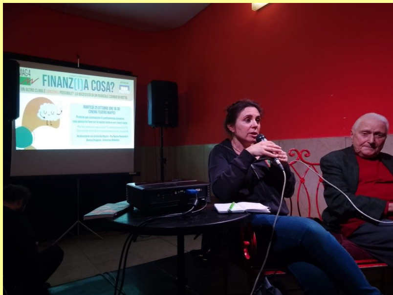
Finanz(i)a cosa? Un altro clima è (ancora) possibile? La necessità di un radicale cambio di rotta

finanziamenti, che calano circa di 1 punto e mezzo percentuale o due: ciò comporta una riduzione di circa 7.000 euro rispetto al 2021;