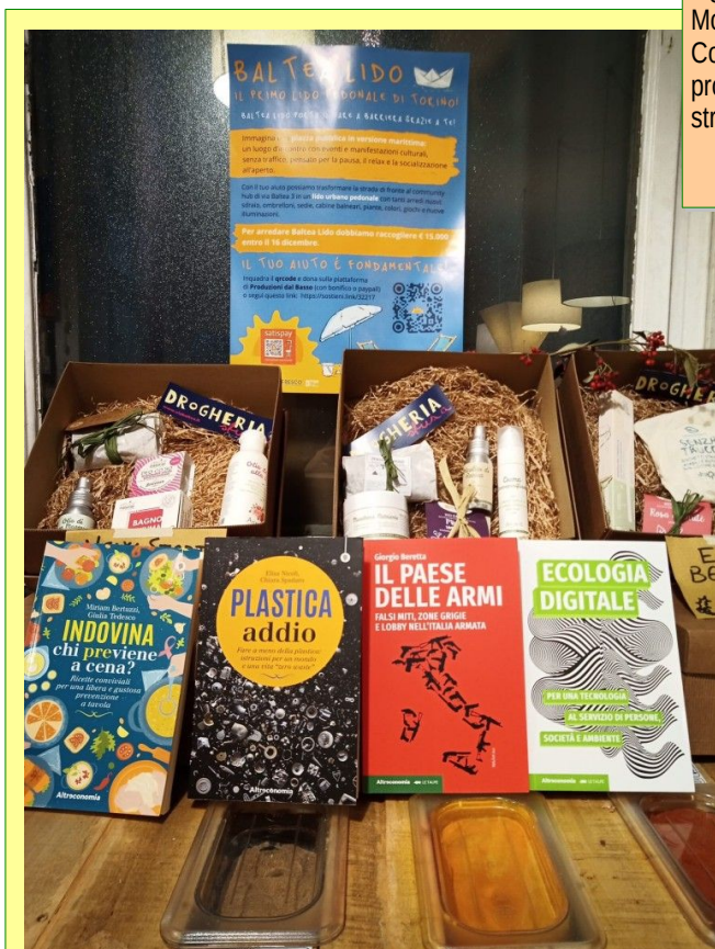
Qualche libro di Altraeconomia ...

Voi cosa ne pensate? Ne discuteremo nell'assemblea del 31 gennaio!