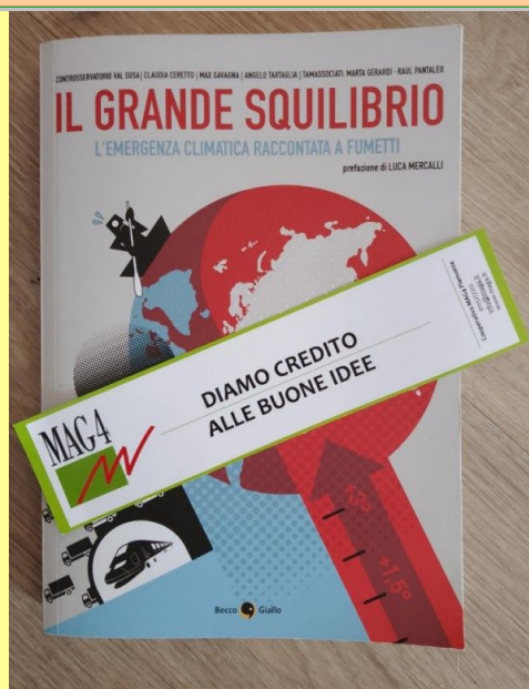
... e uno di autori vari