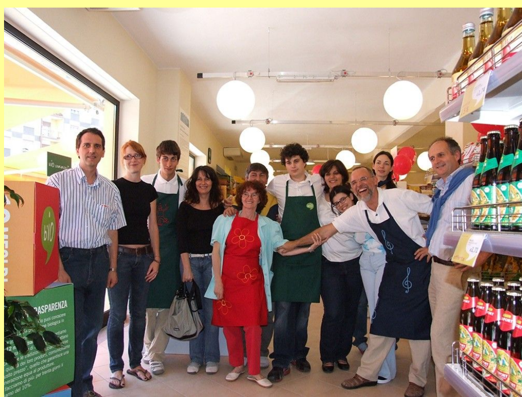
Cooperativa Della rava e della fava

Fin dall'inizio la cooperativa ha raccolto risorse finanziarie dai soci indirizzandole su tre direzioni: sostenere gli investimenti interni (supermercato bio e bottega del commercio equo ne sono un esempio), incrementare la raccolta della cooperativa MAG4 Piemonte per finanziare realtà locali del terzo settore e quella del consorzio Altromercato per sostenere il circuito del commercio equo.